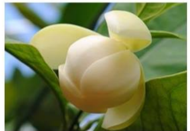
(ផ្កា) យីហុ.....